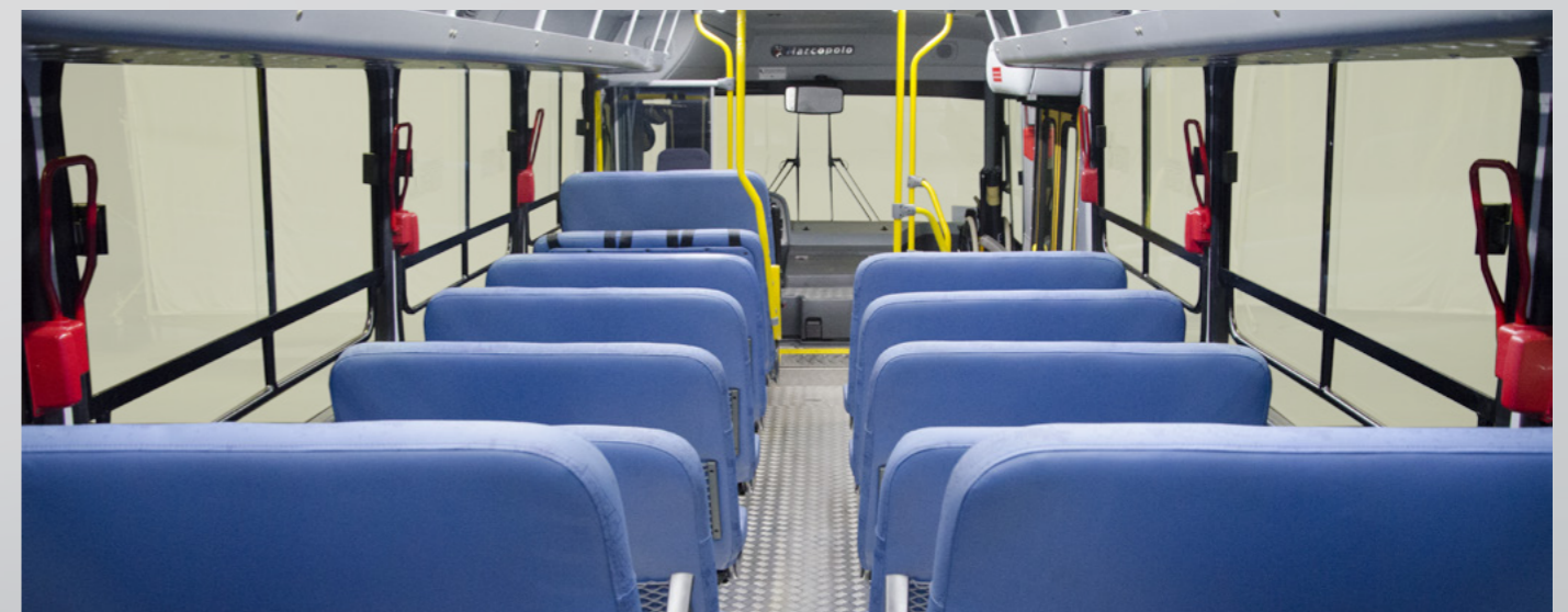
Salão de passageiros: até 59 lugares em poltronas 3x3

Os modelos contam com especificações exclusivas e obedecem as regras estabelecidas pela legislação atual, garantindo segurança e qualidade ao transporte de estudantes da rede básica de ensino público.