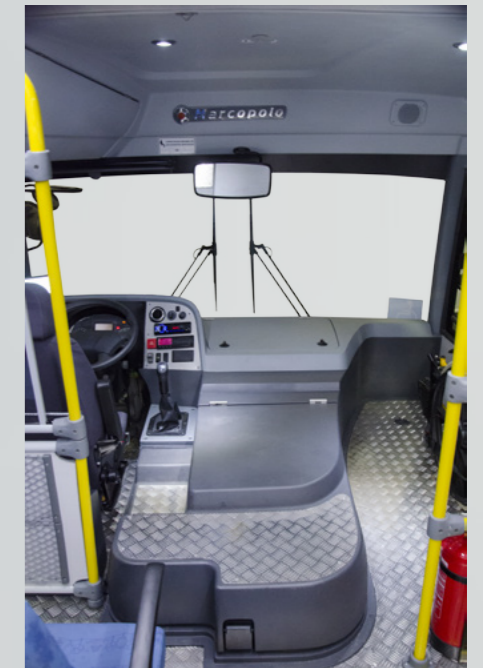
Posto do motorista: espaço e ergonomia