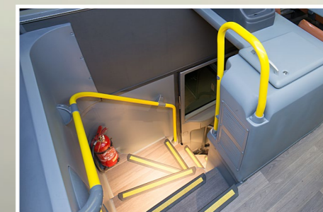
Escadas de acesso mais amplas, com perfis injetados e iluminação indireta

Poltronas Semileito e Semileito Master: novos tecidos e acabamentos. Opção de cinto de segurança de dois ou três pontos.