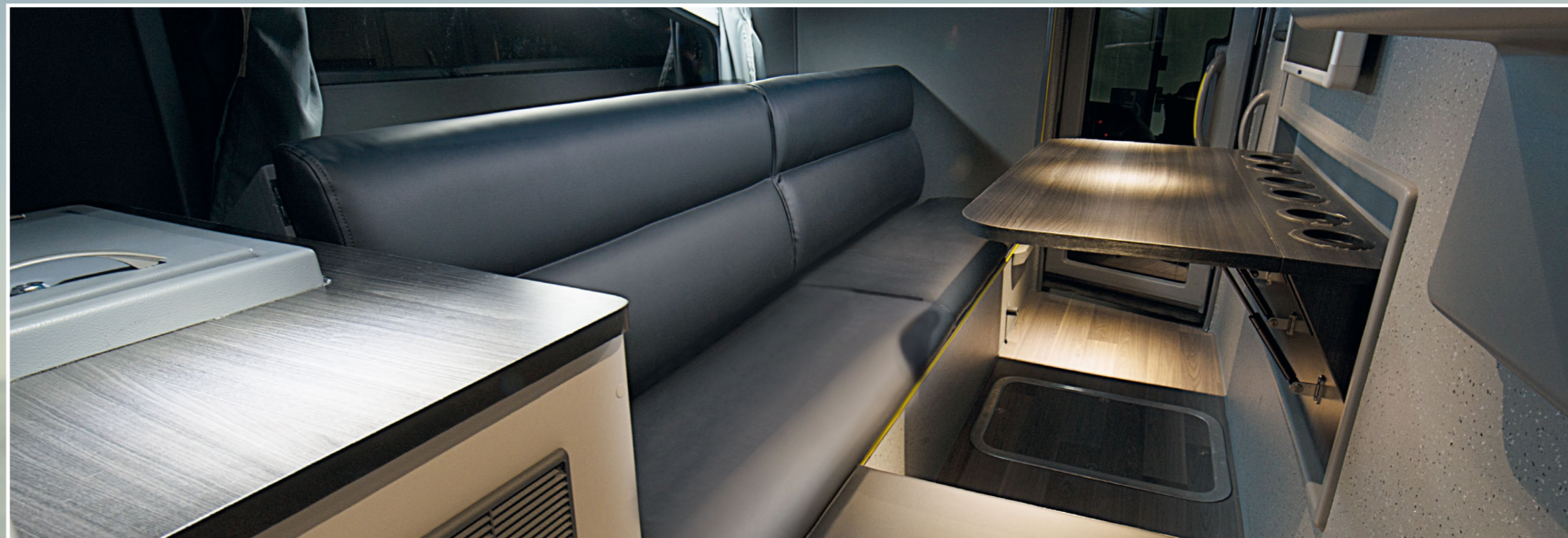
Customização para uso de diferentes formas: Sala VIP, cama para motorista ou ampliar o espaço de bagageiro

A Linha Paradiso New G7 chega trazendo alterações externas e internas que elevam o nível de sofisticação, conforto, segurança e eficiência transformando os modelos já reconhecidos pelo mercado. O Paradiso New G7 1800 DD apresenta conforto e sofisticação combinados para atender as necessidades e superar as expectativas de passageiros, motoristas em linhas de médias e longas distâncias de linhas regulares e de turismo. Modelo pode ainda ser configurado para duas classes de serviços, elevando a qualidade do transporte.