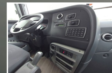
Cabine do motorista com nova iluminação e painel com acabamento soft touch