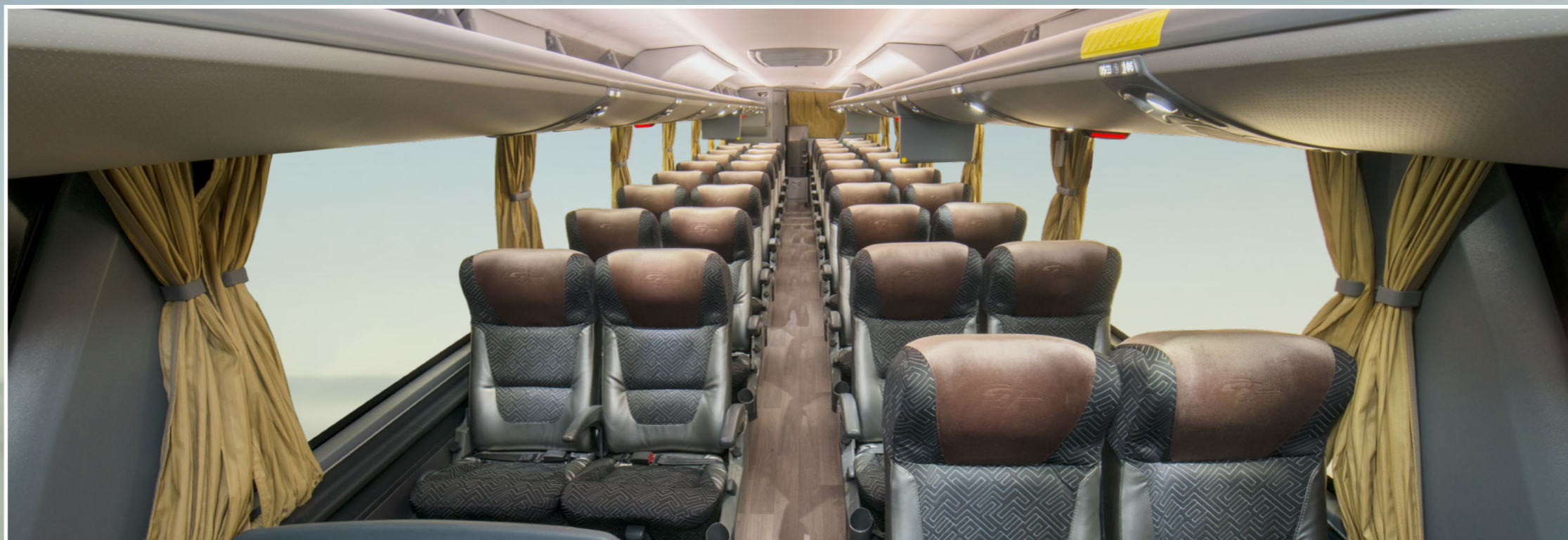
Salão de passageiros com decoração interna renovada e iluminação interna em LED

A Linha Paradiso New G7 chega trazendo alterações externas e internas que elevam o nível de sofisticação, conforto, segurança e eficiência transformando os modelos já reconhecidos pelo mercado. O Paradiso New G7 1600 LD apresenta conforto aliado à tecnologia para atender as necessidades e superar as expectativas de passageiros, motoristas em linhas de médias e longas distâncias, além do segmento de turismo de lazer e de compras.