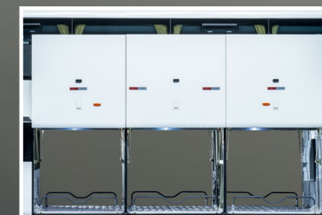
Smart Rack – facilidade e ergonomia para manuseio de bagagens