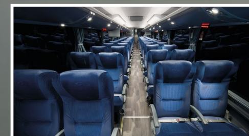
Salão de passageiros: iluminação bio lighting que muda de cor e intensidade de acordo com o horário do dia ou da noite.