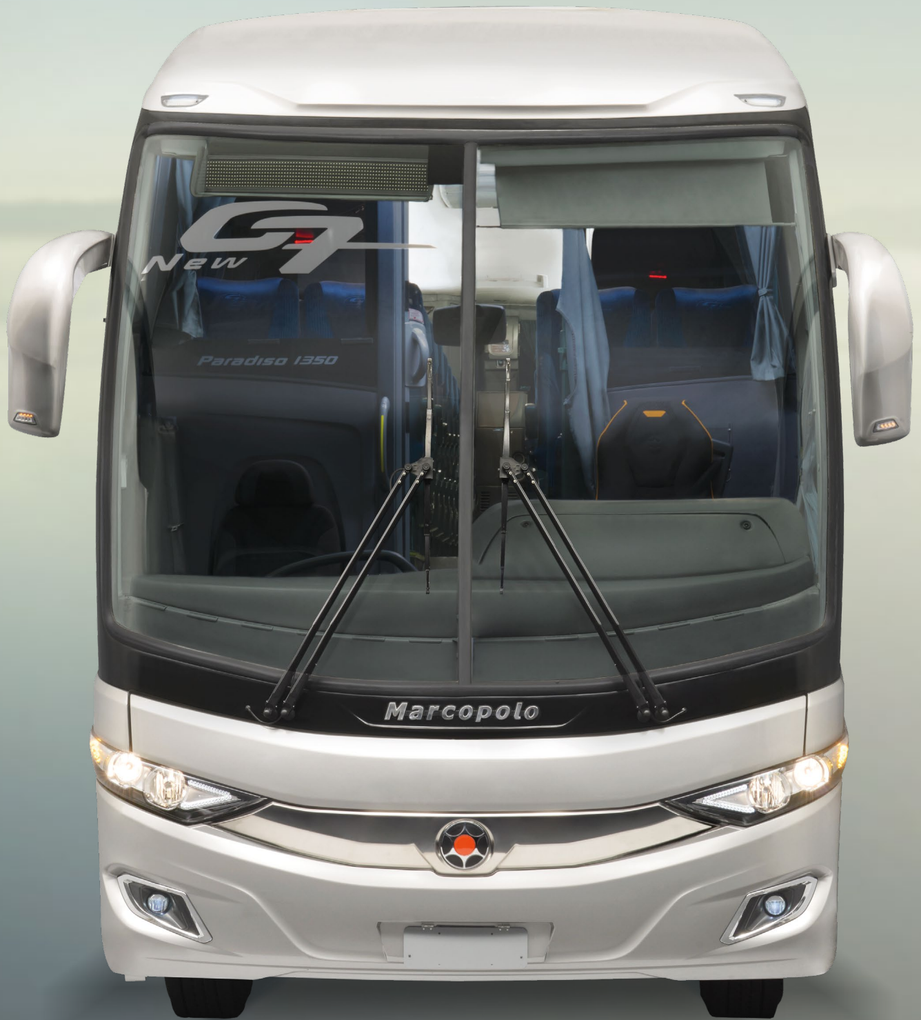
Paradiso New G7 1350