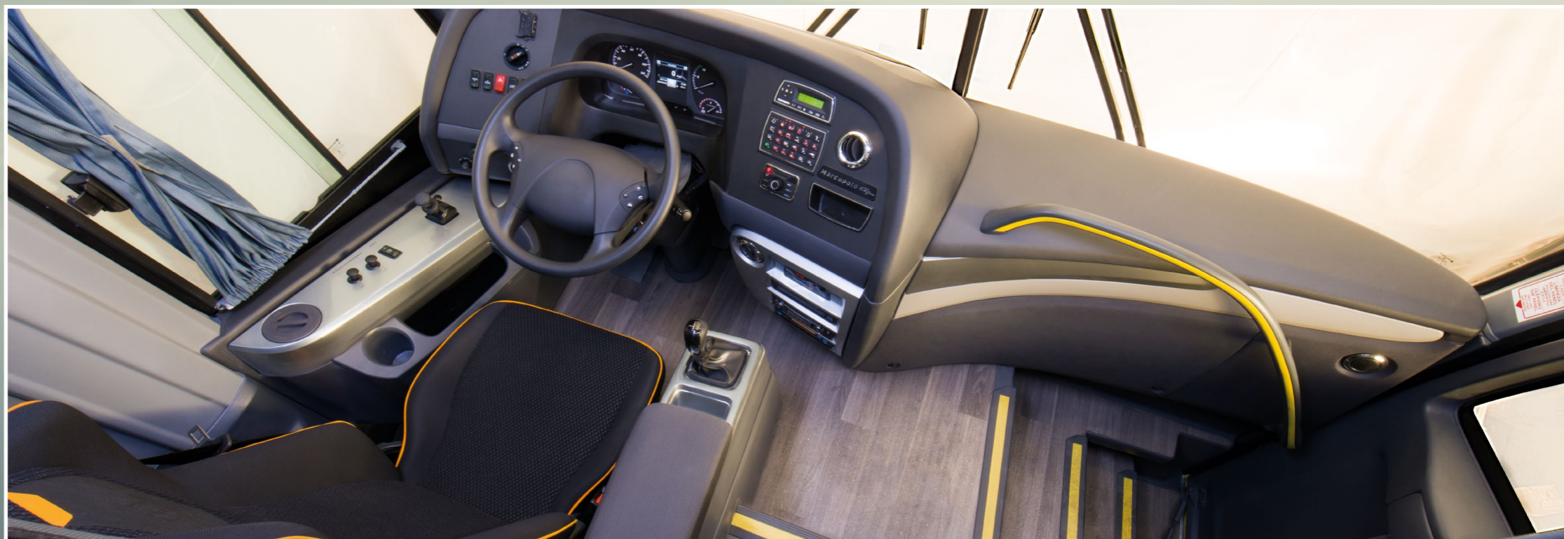
Cabine: novo painel e decoração interna.

A Linha Paradiso New G7 chega trazendo alterações externas e internas que elevam o nível de sofisticação, conforto, segurança e eficiência transformando os modelos já reconhecidos pelo mercado. O Paradiso New G7 1350 apresenta robustez aliada ao conforto para atender as necessidades e superar as expectativas de passageiros, motoristas em linhas de médias e longas distâncias, além do segmento de turismo.