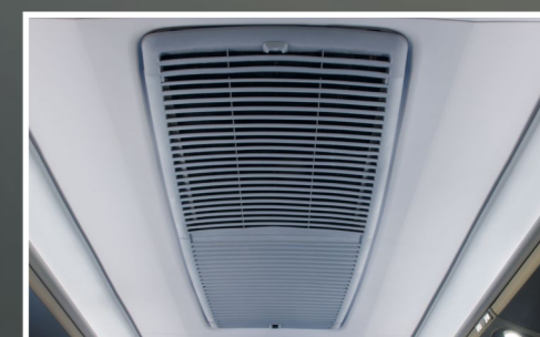
Grade de ar-condicionado integrada ao teto